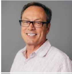
Марк Бэк старший вице-президент Совета по экспорту США (USDEC)