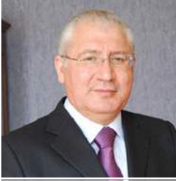
Гейдар Асадов Министр сельского хозяйства Республики Азербайджан